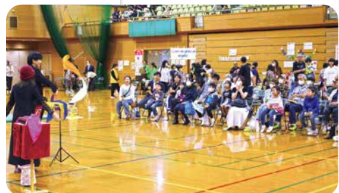
ふれあい福祉フェスティバル

11月 成年後見講座 障がい児・者サロン さむかわ安全・安心フェア (災害ボランティアセンターの紹介)