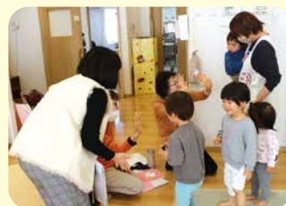
最後はハイタッチ ありがとうございます!

町内のある保育園では、毎月1回ボランティアによる読み聞かせが開催されています。子どもたちはきちんと座って、目を輝かせながら絵本に夢中!「子どもたちとふれあって元気をもらっています」「現在、仲間も募集中。絵本の好きな方、ぜひ一緒に!」と活動する皆さんも楽しそうです。お子さんやお孫さんに絵本を読んであげた経験を生かして、ボランティア活動をしてみませんか。