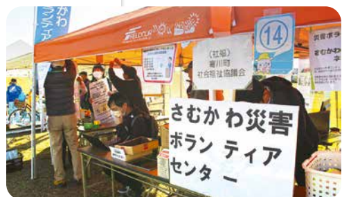
さむかわ安全・安心フェア