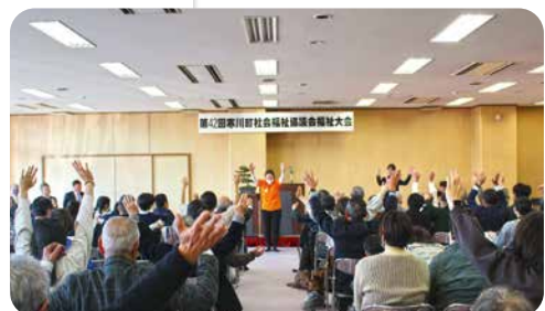
福祉大会(体操の様子)