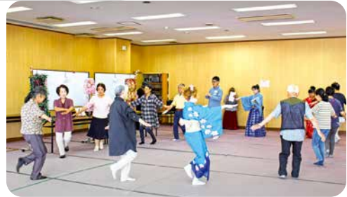
ボランティア交流会

5月 ボランティア交流会 認知症サポーター養成講座・ ステップアップ講座 障がい児・者サロン