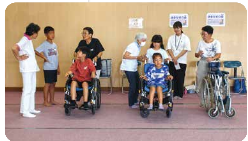
ボランティア体験会