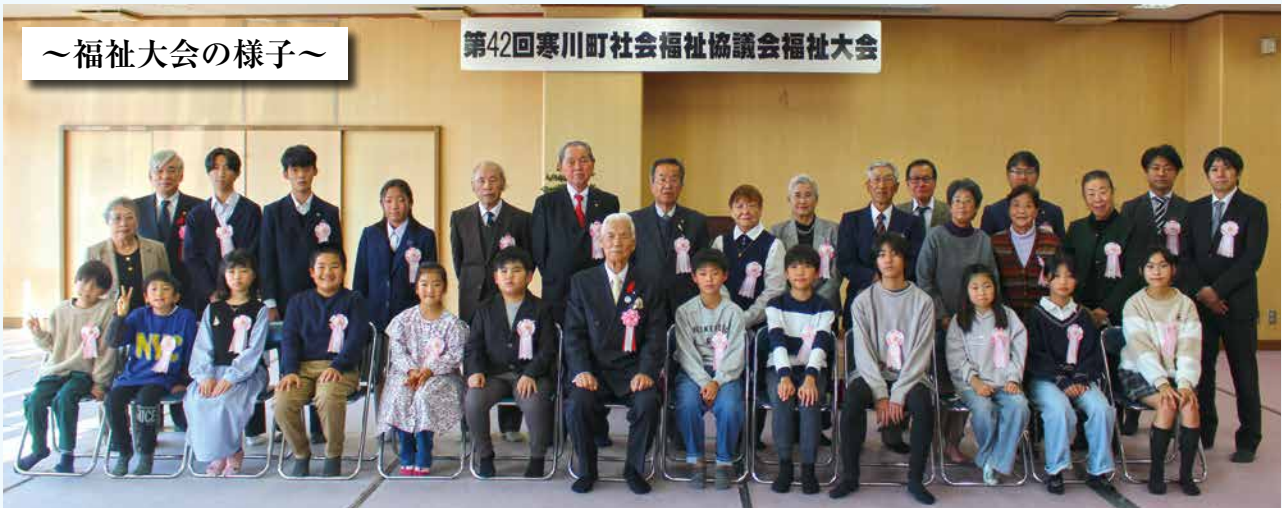
第42回寒川町社会福祉協議会福祉大会