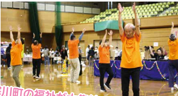
寒川町の福祉が大集結！

会場をシンコースポーツ寒川アリーナに移してから、3年目の開催です！当日はあいにくの雨でしたが、屋内なので安心♪ 35団体によるブースの出展と、6組のパフォーマンスのご披露、大いに盛り上がりました！！ご来場いただいた皆さま、ご協力いただいた関係者の皆さま、ありがとうございました。