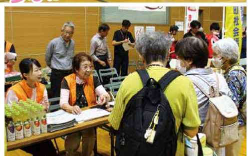
笑顔があふれるひととき😊