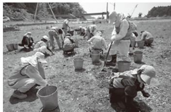
6月の ボランティア 活動の様子