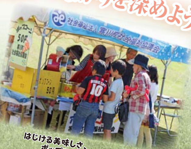
はじける美味しさ、 ポップコーン販売