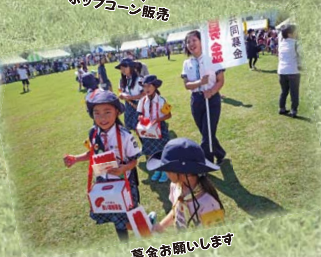
募金お願いします