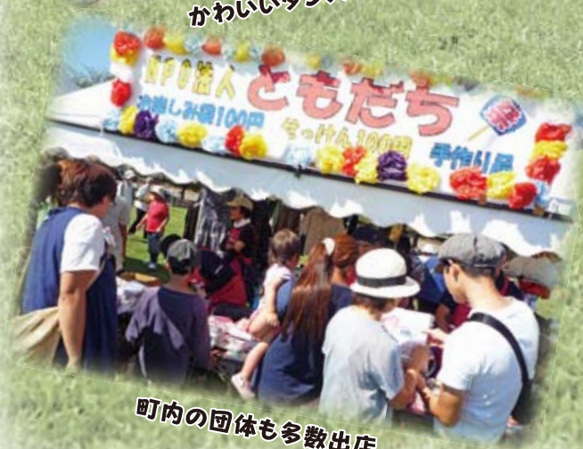
町内の団体も多数出店