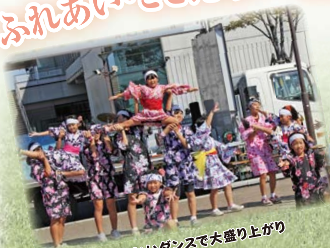
かわいいダンスで大盛り上がり